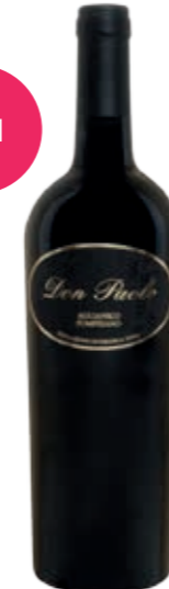
Don Paolo Aglianico IGT Pompeiano Rouge 75 cl x 6