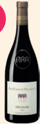
Les Clos de Paulilles AOP Collioure Rouge 75 cl x 6