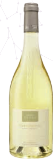
Clos Teddi Tradition AOP Patrimonio Blanc 75 cl x 12 - 2016