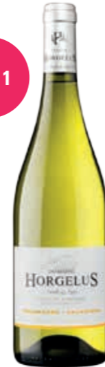
Colombard - Sauvignon Blanc IGP Côtes de Gascogne Blanc 75 cl x 6