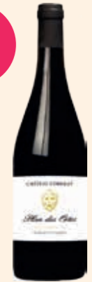
Château Comolet Plan des Ortes AOP Grès de Montpellier Rouge 75 cl x 6 - 2015