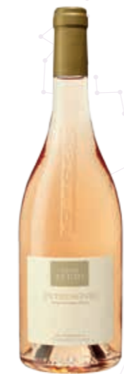
Clos Teddi Tradition AOP Patrimonio Rosé 75 cl x 12 - 2016